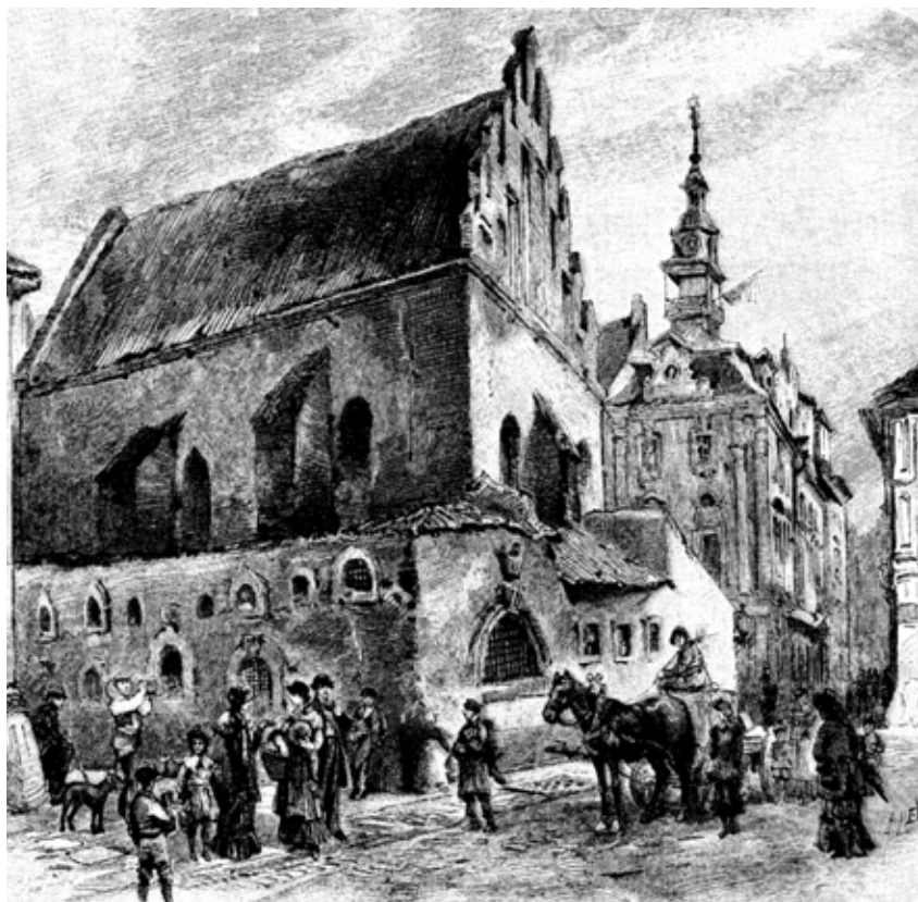
Blick auf die Altneusynagoge und das Jüdische Rathaus zu Prag.