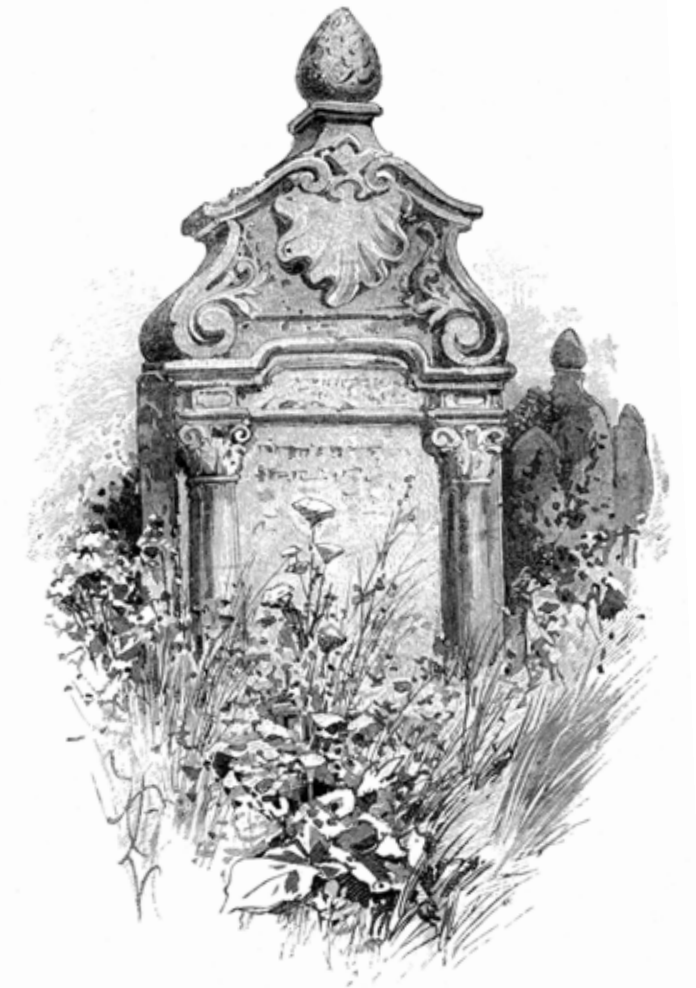
Grabstein auf dem Alten Jüdischen Friedhof.

und Bethäusern ein strenges Verbot verkünden, den Dachboden der Altneusynagoge zu besteigen. Die Überreste von Büchern und anderen heiligen Dingen durften dort nicht mehr aufbewahrt werden.